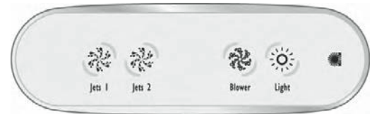
Esempio di un quadro ausiliario disponibile